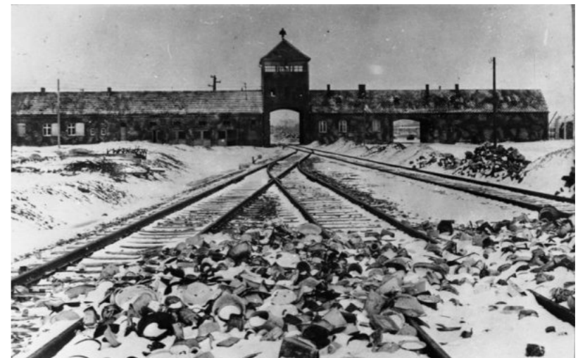
Der Machtapparat der Nationalsozialisten