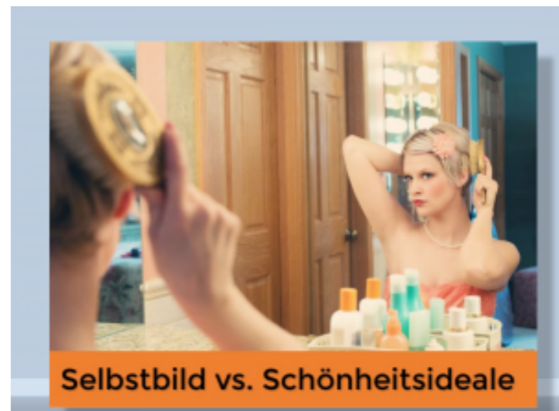
Das Thema Selbstbild vs. Schönheitsideale kollaborativ erarbeiten