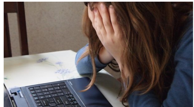
Nur ein Spiel?