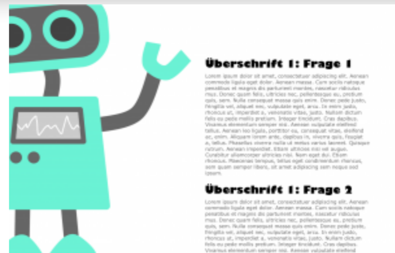
Ein Handout zum Thema Robotik erstellen