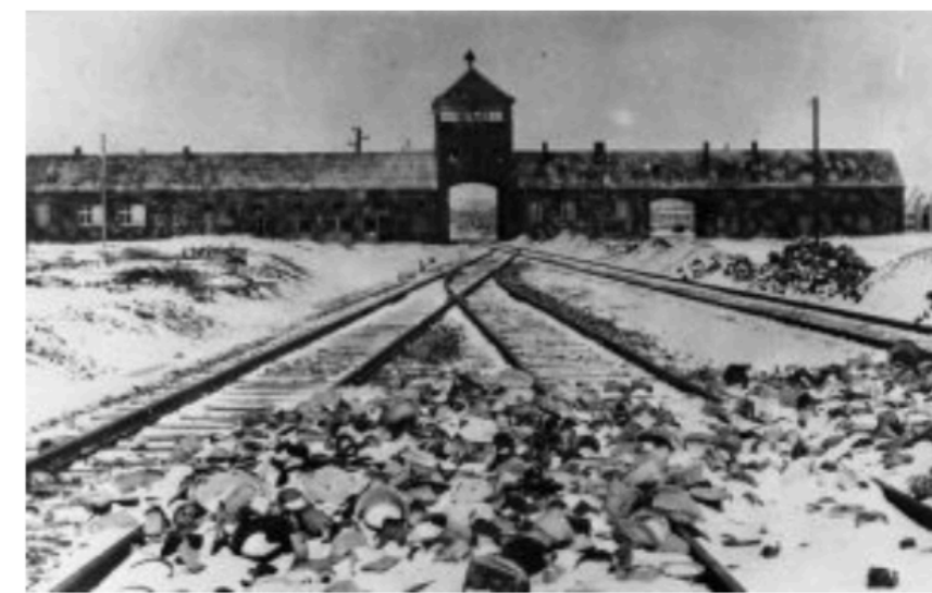
Bild: „KZ Auschwitz, Einfahrt“ von Bundesarchiv, B 285 Bild-04413/Stanislaw Mucha unter der Lizenz CC BY-SA

Das berüchtigte „Judenreferat“ unter Adolf Eichmann war eine Dienststelle der .